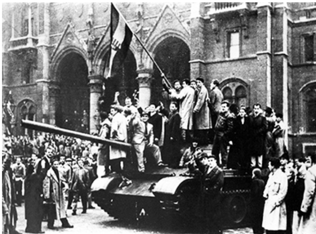
Civilister flokkes på en T-54 kampvogn, efter at dele af den ungarske hær har tilsluttet sig opstanden.