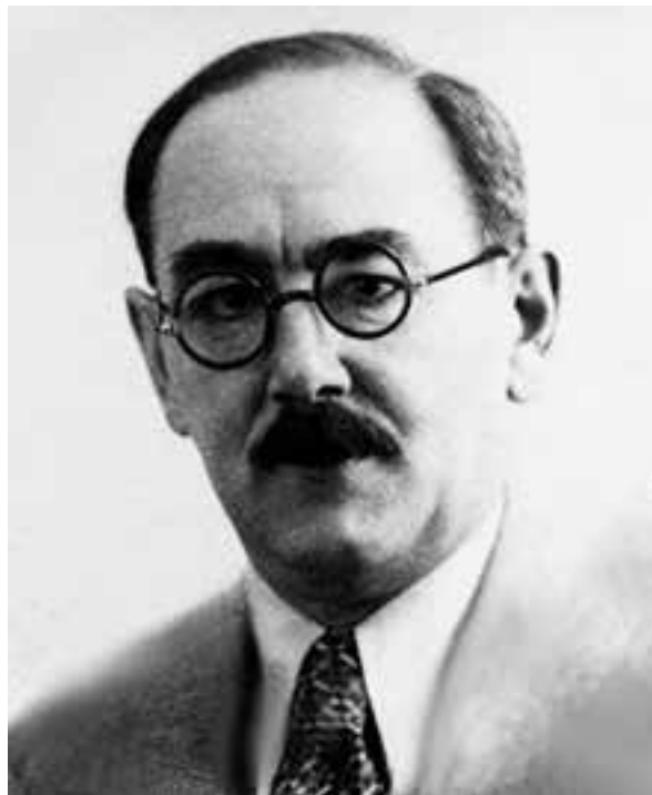
Imre Nagy (foto fra 1945)

henhold til mulighederne” – bestræbte sig på at give ungarerne politisk støtte. Den tillod, at den polske presse berettede objektivt og omfattende om den ungarske revolution, og at skrifter, appeller og telegrammer, som udtrykte tilslutning til begivenhederne, blev offentliggjort. Stiltiende tog partiledelsen pro-ungarske solidaritetsforanstaltninger og demonstrationer til efterretning. I byen Olsztyn i det østlige Polen kom det til den største