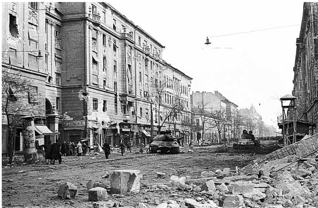
Ødelæggelser i Budapest efter at invaderende sovjetiske styrker har nedkæmpet opstanden. I centrum af fotoet ses en tung kampvogn af typen JS-3, til højre en T-34/85.

Sovjetunionen om regulering af relationerne og om stationering af sovjetiske tropper i Ungarn. Det var åbenbart, at man fra ungarsk side i diskussionen af disse spørgsmål forudså kravet om tilbagetrækning af de sovjetiske tropper; et krav, som PZPR's ledelse i relation til Polen knap et døgn tidligere på ny, umisforståeligt for enhver og principielt havde forkastet. Den polske ledelse svarede inden for halvanden time: Hvis det var acceptabelt for begge parter, så gav den polske regering sin støtte. Så snart der var opnået enighed om tidspunktet for forhandlingerne, ville man også informere offentligheden. Ved på denne måde at opfylde den ungarske regerings anmodning gjorde PZPR's politbureau på ny "særstandpunktet fra Brest" gældende.