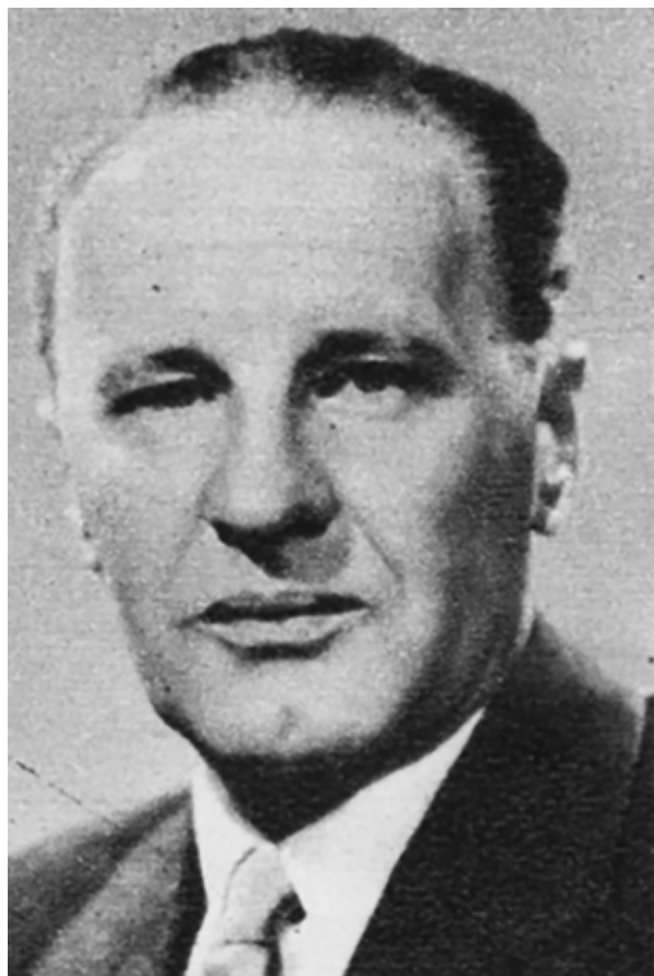
János Kádár (foto fra 1957)

Gomułka en delegation til Budapest, som skulle skaffe sig førstehåndsinformationer. Endvidere skulle delegationen arbejde på at forhindre en yderligere ”højredrejning” af revolutionen og at få Nagy og Kádár til at standse yderligere forandringsprocesser. Dette besøg gav tillige en gunstig anledning til at bekræfte Polens støtte til den ny ungarske ledelse og entydigt at fordømme, at