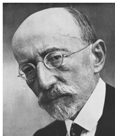
Ascher Ginsberg, "Achad Ha'am" (1856-1927)

En mindre del, som især kom fra den dannede middelklasse, var ikke længere religiøs og udtrykte frem for alt sin jødedom kulturelt. Hertil hørte også genoplivelsen af det hebræiske sprog ikke blot til bøn og studium, men til et samtidigt skrevet og talt sprog. Fra disse kredse af hebræiske oplysningsfolk stammer de zionister, der ikke som Herzl begrundede deres "ønske om tilbagevenden" til Palæstina med antisemitismen, men med det dybe ønske om, at deres oprindelsesland skulle blive et åndeligt centrum for opståen af en moderne hebræisktalende kultur og et værn mod den fremadskridende assimilation. Hovedrepræsentanten for denne gruppe var Ascher Ginsberg, bedre kendt under sit pseudonym Achad Ha'am – "en af folket". Han kritiserede Herzl for at ville overføre et idealiseret Europa til Mellemøsten og dermed at tilstræbe