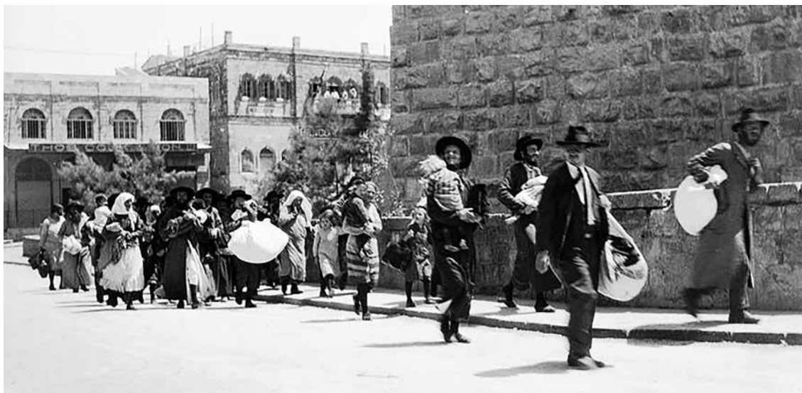
Urolighederne i 1929: Jøder flygter ud af Jerusalems gamle bydel.

som en slags ”førstatslig stat”, hvis udøvende myndighed i Jerusalem skulle drage omsorg for indvandringen til Palæstina, opkøb af jord samt den kulturelle opbygning. Begejstringen over oprettelsen af Jewish Agency svandt dog hurtigt. Børskrakket i Wall Street påvirkede også Palæstinas udvikling, og i august 1929 udbrod de alvorligste uroligheder siden begyndelsen af mandatperioden. Anledningen var statusspørgsmål vedrørende Grædemuren, resten af vestmuren i det ødelagte Andet Tempel og tillige jødedommens helligste sted. Allerede i årene forinden havde den muslimske tempelbjergsmyndighed Waqf betragtet opstil-