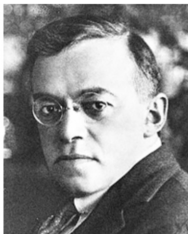
Vladimir Zeev Jabotinsky (1880-1940)

I den første tredjedel af det tyvende århundrede fremkom der to nye varianter: den socialistiske og den nationalistiske zionisme. En stor del af de østeuropæiske zionister identificerede sig med socialistiske idealer, så som afskaffelse af kapitalismen og opbygning af kollektive landbrugskolonier, der senere fandt konkret form som kibbutzer. Hermed blev Palæstina også til en tumleplads for socialistiske eksperimenter. Socialrevolutionære ideer fra russiske miljøer blandede sig med zionistiske idealer. Efter Første Verdenskrig fremstod den fra Polen stammende politiker David Ben-Gurion som den ledende figur i denne politiske lejr.