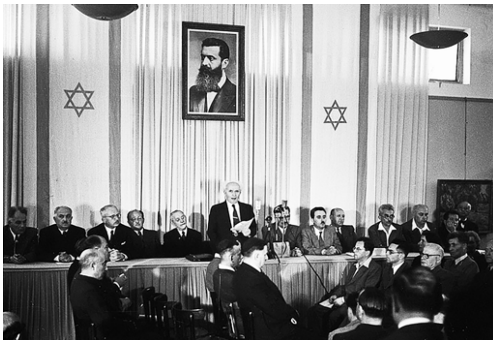
14. maj 1948: Under et portræt af Theodor Herzl udråber David Ben-Gurion Staten Israel.

Også den store palæstinensiske diaspora i den vestlige verden og i Golfstaterne går især tilbage til den begyndende hjemløshed i disse år. Således betyder begivenhederne i 1948/49 for den ene part al-Nakba (arabisk: katastrofen) og for den anden part den længe ventede tilbagevenden til statslighed efter to tusind år i udlændighed.