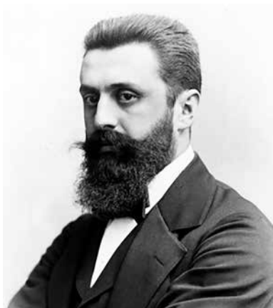
Theodor Herzl (1860-1904)

foreslog man et område i det nuværende Kenya. Men han forstod, at der i grunden kun var ét sted, hvor jøderne havde en historisk ret til bosættelse, og til hvilket de var følelsesmæssigt bundet. Det var Landet Israel, hvor deres historie var begyndt tre tusind år tidligere.