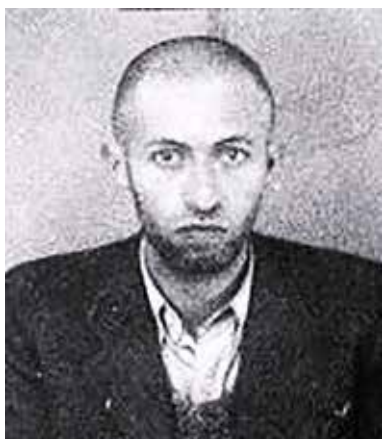
Menachem Begin (1913-1992) foto fra 1940 hvor Begin var flygtet fra det tyskbesatte Polen til Vilnius og dér blev arresteret af NKVD

I begyndelsen bestod den zionistiske modstand i organiseringen af den illegale indvandring af jødiske flygtninge til det af briterne stadig spærrede Palæstina. I de første måneder af 1946 nåede antallet af de "illegale" op på over tusind om måneden. Derpå intensiverede briterne blokaden og indsatte i alt 26.000 jødiske flygtninge i interneringslejre på Cypern. Størst opsigt skabte tilbagesendelsen af de 4.500 jødiske displaced persons på det overfyldte flygtningeskib "Exodus 1947" til lige netop tysk jord. At holocaustoverlevende efter deres befrielse fra koncentrationslejrene nu mod deres vilje blev fastholdt i tyske og cypriotiske interneringslejre og hindret i deres immigrering til Palæstina fik en moralsk betydning for den politiske beslutning om at oprette en jødisk stat, som på ingen måde kan undervurderes.