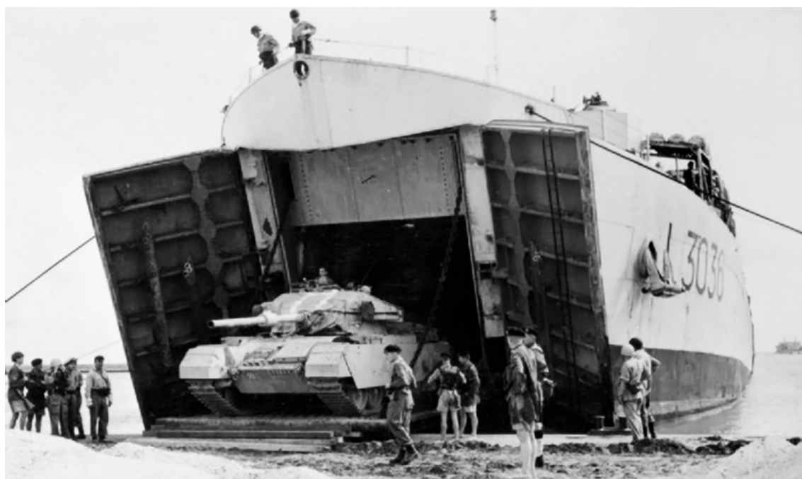
Britisk Centurion -kanpvogn kører i land i Port Said fra landgangsskibet HMS Puncher .

”med risikoen for forfærdende ødelæggelser”. 18 Den fransk-britiske intervention kom ikke ubelejligt for Sovjetunionen, idet den med sit ultimatum kunne aflede den internationale kritik fra sin fremfærd i Ungarn. Sluttelig måtte, Frankrig, Storbritannien og Israel bøje sig for presset fra USA, USSR og FN. Den 6. november blev kampene indstillet. Den 3. december erklærede de sig rede til at trække deres tropper væk fra krigsskuepladsen, hvorefter der skulle rykke FN-tropper ind. Tilbagestrækningen forløb frem til 22. december.