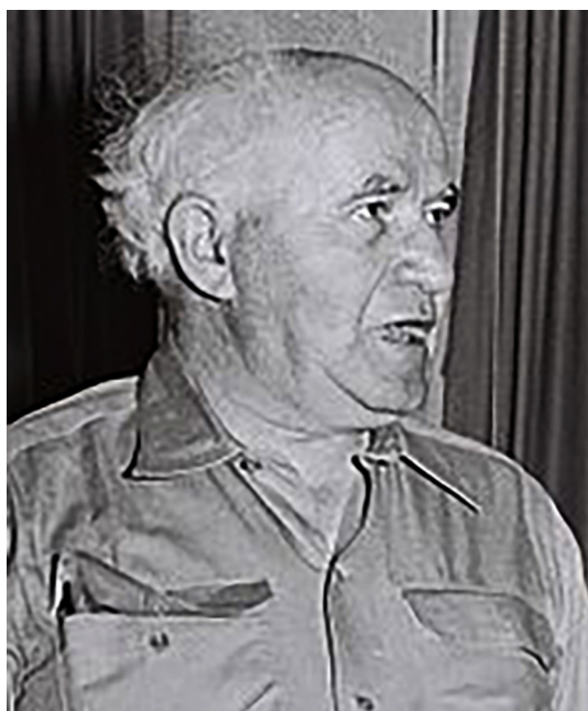
David Ben-Gurion Israels ministerpræsident 1948-53 og 1955-63 (foto fra 1955)

Egypten; men planen mandede ud i en hensigt om at iscenesætte operationen som en fredsskabelse mellem Israel og Egypten. Med dette for øje kom det til et hemmeligt møde mellem Frankrig, Storbritannien og Israel 22. til 24. oktober i Sèvres ved Paris, hvorunder Guy Mollet, Christian Pineau, David Ben-Gurion, Shimon Peres, Moshe Dayan og Selwyn Lloyd udkastede et machiavellisk scenario. 14 De egyptisk-jordanske krigsforberedelser skulle give Israel påskud for et angreb på