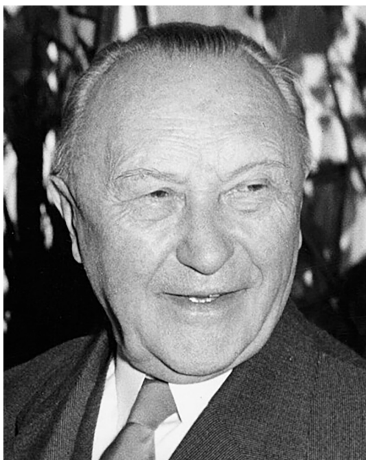
Konrad Adenauer Forbundskansler i Forbundsrepublikken Tyskland 1949-63 (foto fra 1957)

ikke var indsats klare til et sådant slag. Pokerspillet fungerede og bekræftede Khrusjtjov i overbevisningen om også i fremtiden at kunne lave international politik med nukleart bluff. Suezkrisen udgør i denne henseende en grundlæggende bestanddel i forhistorien til Berlin- og Cubakriserne. 26 På dette tidspunkt havde de to europæiske kolonialmagter ikke andet valg end at trække sig tilbage: De havde måttet indse, ”hvor tæt grænserne [...] var trukket i styrkespillet mellem øst og vest”. 27