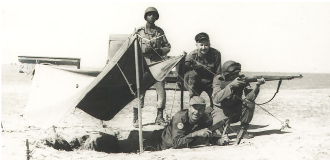
Brasilianske soldater i Sinai i 1957 som en del af UNEF - United Nations Emergency Force. Danmark bidrog med soldater - i alt omkring 11.000 - i hele UNEF's indsatsperiode, 1956-67. (Den liggende soldat holder en Madsen M-50 maskinpistol, der blev produceret på licens i Brasilien.)

Denne vilje til afspænding forklarer, hvorfor amerikanerne reagerede tilbageholdende på den ungarske revolution den 23. oktober og selv efter sovjetiske troppers blodige nedkæmpelse af denne indskrænkede sig til protestresolutioner i FN's generalforsamling. Tilsvarende motiver kan også erkendes bag det amerikanske pres på Storbritannien og Frankrig. Da disse greb ind ved kanalen var det konsekvent, at USA gennem FN-afstemninger samt valuta- og handelspoliti-