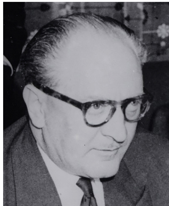
Guy Mollet Frankrigs ministerpræsident 1956-57 (foto fra 1956)

Også den franske politisk sigtede nu på krig. Paris anklagede Nasser for at støtte den algeriske uafhængighedsbevægelse. I modsætning til Frankrig var den offentlige opinion i Storbritannien imidlertid ikke positivt stemt over for et sådant eventyr. Premierminister Anthony Eden, der i mellemkrigstiden havde været modstander af Chamberlains appeasement-politik, ønskede gennem henvisning til Münchenkonferencen af at vende stemningen hos sine landsmænd og sammenlignede Nasser med Hitler og Mussolini. Mens Nasser i dag fremstår som en karismatisk leder, ”som gennem udenrigspolitiske succeser ønskede at føre sit fattige land til fremskridt af vestlig prægning”, 11 forblev Edens politiske tænkning helt og holdent fikseret på ”München”. 12