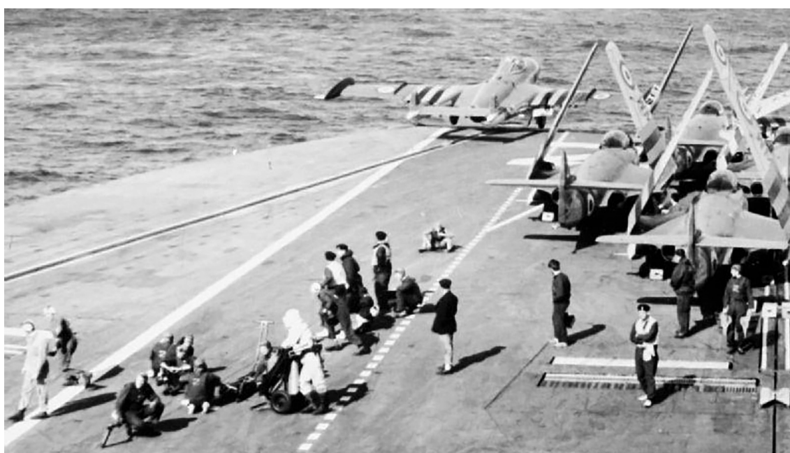
Et De Havilland Sea Venom letter under Suezkrisen fra det britiske hangarskib HMS Albion.

Nasser ville blive efterfulgt af en sejr over den algeriske uafhængighedsbevægelse. Endvidere gjorde "München-syndromet" sig stærkt gældende. Den 5. september 1956 havde Mollet i partiledelsen for de franske socialister advaret mod at give en diktator frie hænder: "Naturligvis er Nasser ikke Hitler, men han anvender dennes metoder. Vi må derfor ikke tillade ham en første succes, for det kan udløse et nyt magtbegær hos ham." Kort efter indledningen på militærinterventionen erklærede han offentligt: "Vore fædre [...] har som arvgivet os den lære, at der er større værdi i at dø, end