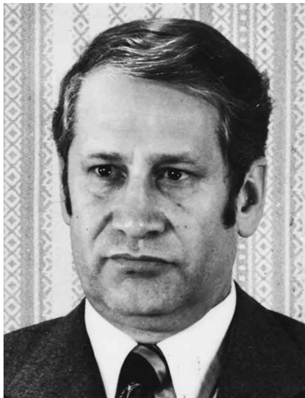
Markus Wolf, generaloberst, 1953-86 chef for HVA