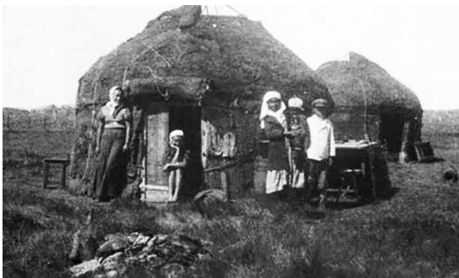
Fotoet viser angiveligt deporterede polakker i Kasakhstan eller Usbekistan.

at skabe gennemsigtighed – glasnost – i det sovjetiske samfund, kom gennembruddet. I 1989 afslørede sovjetiske forskere, at Stalin havde beordret massakren, og i 1990 indrømmede Gorbatjov, at NKVD havde myrdet de polske krigsfanger, ligesom han gav oplysninger om to yderligere gravpladser. I 1992 overdrog Boris Jeltsin som præsident for Den Russiske Føderation dokumenterne fra Katyn-sagen til Polens daværende præsident, Lech Wałęsa.