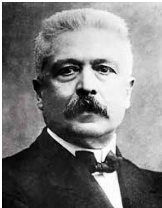
Vittorio Orlando, Italiens regeringschef 1917-19, foto fra 1916

I fransk perspektiv udgjorde sikkerheden i relation til Tyskland det afgørende orienteringspunkt. Et genstyrket Tyskland måtte ifølge opfattelsen hos den franske regering under Georges Clemenceau og hos den militære ledelse under marskal Ferdinand Foch under alle omstændigheder forhindres, og til dette formål tjente kravet om Rhingrænsen; ligesom de senere forbund med de nydannede stater i Østcentraleuropa også gjorde det. Den franske stillingtagen blev suppleret med et krav om høje krigsskadeerstatninger, som ikke blot skulle kompensere for den omfattende ødelæggelser i Nordfrankrig, men også på lang sigt inddæmme den tyske industrielle styrke.