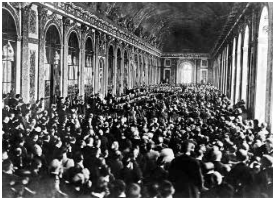
Underskrivelsen af de allieredes fredstraktat med Tyskland i Spejlsalen i Versailleslottet den 28. juni 1919. Fredstraktaterne med Østrig, Ungarn, Bulgarien og Tyrkiet blev underskrevet i andre parisiske forstæder - heraf den samlede betegnelse ”de parisiske forstadstraktater”.

Resultatet af fredsforhandlingerne i Paris var et komplekst kompromis mellem skuffede sejrherre, som ikke tilfredsstillede nogen. I modsætning til på Wienerkongressen 1814/15 eller på Berlinkongressen 1878 agerede de politiske aktører ikke længere som en isoleret elite i det diplomatiske elfenbenstårn. Ikke blot Wilson, Clemenceau og Lloyd George, men også de tyske østrigske, ungarske, tyrkiske og italienske delegationer måtte formidle deres afgørelser og forhandlingernes resultater til deres hjemlige samfund. 28