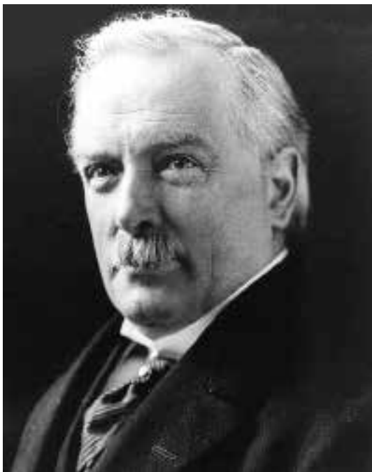
David Lloyd George, Storbritanniens premierminister 1916-22, foto fra 1919

stater, men ikke de tabende fik adgang. Først i den sidste fase, efter overrækkelsen af traktatudkastet til den indtil da fra alle forhandlinger udelukkede tyske delegation og derpå til Østrigs, Ungarns,