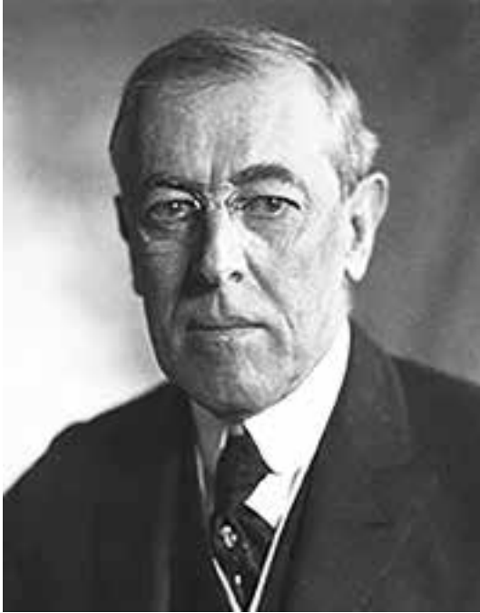
Woodrow Wilson, USA's præsident 1913-21, foto fra 1919

sentanter, diplomater og talrige eksperter i militære, økonomiske og retlige spørgsmål, men også erhvervsrepræsentanter og hundredvis af journalister fra hele verden, som skulle gøre fredskonferen-