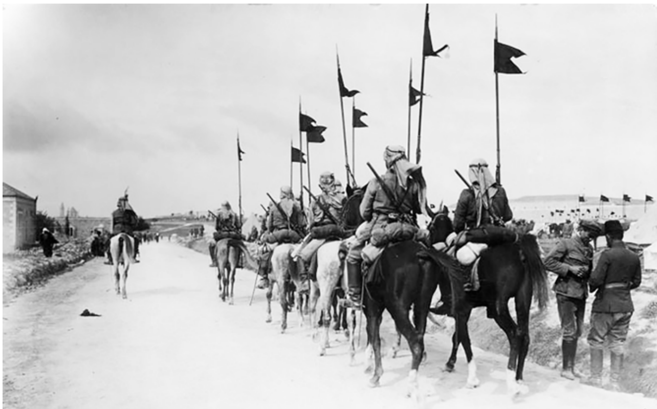
Tyrkisk kavaleri syd for Jerusalem i april 1917.

kationsmulighederne. Afstandene var enorme. Alle vigtige telegrafforbindelser blev kontrolleret af virksomheder i modstandernes stater. Det tog næsten en uge at få et telegram fra Berlin til hovedstaden i det neutrale Persien. Dermed var det så godt som umuligt at nå Øst- eller Sydpersien for ikke at tale om Afghanistan. Der blev søgt efter et alternativ i den ny radioteknik. Med udgangspunkt i den i 1916 stærkt udbyggede radiostation i Nauen i Brandenburg blev der oprettet en yderligere radiostation ved Bosphorus. Denne blev igen koblet til telegrafstationer og mindre radiofaciliteter i Mellemøsten. I 1917 eksisterede der desuden mobile radiostationer i Vestpersien, som tillod en skrøbelig nyhedsformidling til Afghanistan. Bestræbelserne for at opbygge en solid kommunikation til Centralasien, Arabien og Nordøstafrika blev imidlertid ikke kronet med succes.