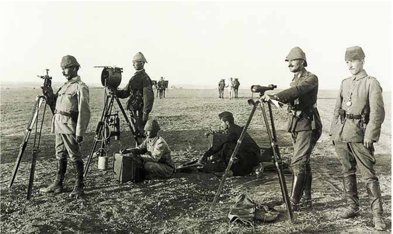
Tyrkiske soldater betjener en heliograf ved Huj i Gaza i 1917.

let om øjeblikkelige krigsforberedelser. I stedet stillede han nye krav, som næppe lod sig opfylde inden for et overskueligt tidsrum – blandt andet en umiddelbar støtte fra tyske eller tyrkiske tropper i tilfælde af et angreb fra Britisk Indien. 14 Til slut forlod den tyske delegation skuffet Afghanistan. Forventningen om gennem oprettelsen af en indisk eksilregering i Kabul at kunne organisere en indisk opstand blev heller ikke opfyldt. 15 Først efter mordet på Habibollah og indsættelsen af hans søn Amanollah på tronen kom det i maj 1919 faktisk til en afghansk-britisk krig, som følge af hvilken Storbritannien ligeledes blev tvunget til at anerkende den afghanske suverænitæt.