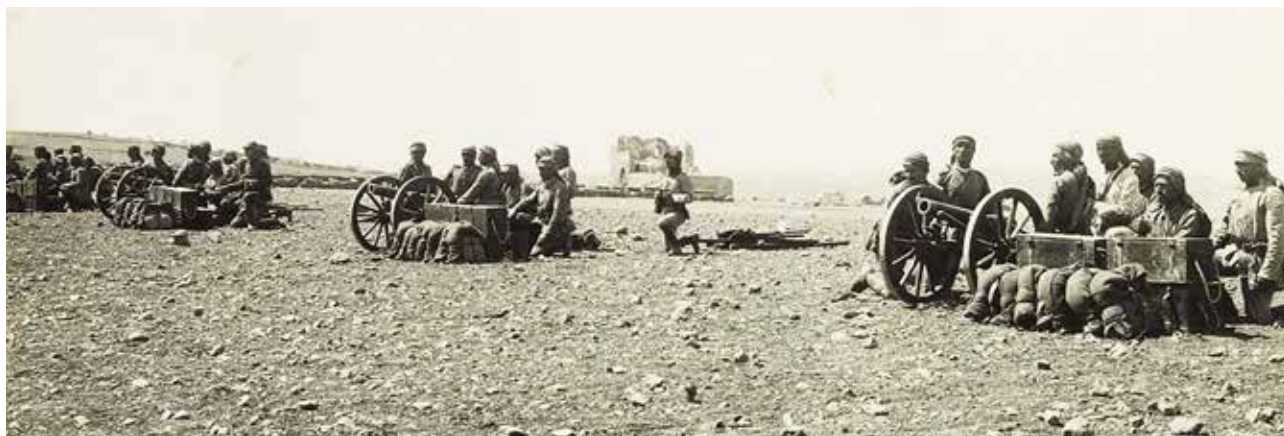
Tyrkisk bjergartilleri på Rafaim-sletten sydøst for Jerusalem i 1916.

Afghanistan havde gennem de foregående årtier måttet afstå betragtelige dele af sit territorium til Britisk Indien. Som følge heraf var der en stærk gruppering i den afghanske hovedstad, som ikke var afvisende over for et samarbejde med Det Tyske Rige. 13 Imidlertid var den herskende emir Habibollah ikke rede til en klar stillingtagen. Ganske vist kom det den 24. januar til en indgåelse af en afghansk-tysk traktat, i hvilken Det Tyske Rige som den første europæiske stormagt anerkendte landet som suveræn stat. Traktaten manglede imidlertid en entydig fastlæggelse af Afghanistans krigsindtræden. Emiren holdt til stadighed tyskerne hen, når det kom til spørgsmå-