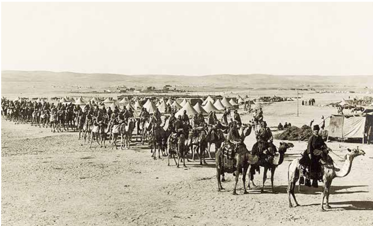
Tyrkisk kamelkorps ved Beersheba i 1915.

god jordbund. Visioner af denne art var udbredte; der manglede imidlertid konkrete planer. I sommeren 1914 var der intet forberedt i denne henseende. I stedet var, ifølge historikeren Gerd Koenen, de første foranstaltning snarere ”født ud af isolationens nød” og bar så rigeligt ”præg af en hastig improvisation”. 5