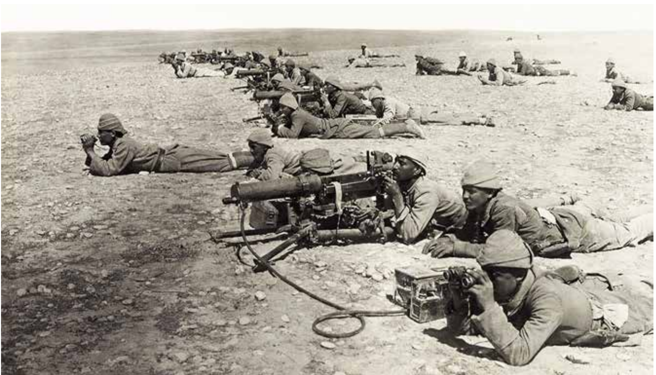
Tyrkiske maskingeværer - tilsyneladende Maxim-maskingeværer svarende til det tyske MG 08 - i Gaza-linien i 1917.

Ydermere havde relationerne til Storbritannien i årevis været stærkt belastede, idet Abessinien udgjorde en vigtig basis for våbensmuglere i det urolige Sudan og for Mohammed Abdullah Hassans (”Den Gale Mullah”) siden 1899 meget succesfulde oprørsbevægelse i Somalia. 16 Det var imidlertid af en større strategisk betydning, at den ene af Nilens to kilder lå i Abessinien. Ikke mindst briterne selv var opmærksomme på, at en blokade af Den Blå Nil ville få alvorlige følger for den socioøkonomiske situation i alle regioner ved flodens nedre løb. Et indgreb fra Abessinien på den tyske side havde potentiale til at få flere ulmende bål til at flamme op i en stor brand. I Somalia havde briterne allerede i 1915 trukket sig tilbage til nogle få kystbastioner. Sudan var aldrig blevet rolig efter nedkæmpelsen af den fundamentalistiske Mahdistat i 1898. Med udgangspunkt i Libyen bekæmpede den indflydelsesrige sufistiske Senussi-orden