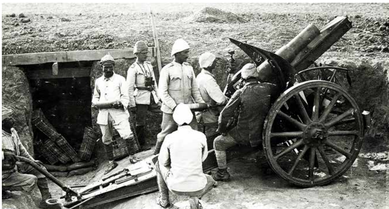
Tyrkisk artilleripjece – tysk 10,5 cm let felthaubitze 98/09 - ved Harcira i 1917.

I sensommeren 1916 blev Iyasu sluttelig væltet: Sammen med størsteparten af ministrene erklærede de højeste kirkerepræsentanter ham for afsat. Kupmagerne erklærede den 18-årige søn af en indflydelsesrig provinsguvernør, Tafari Makonnen, for foreløbig regent og fremtidig tronarving; han blev senere kendt som den sidste etiopiske kejser Haile Selassie I. De tyske statsborgere i landet blev interneret. Ganske vist førte den afsatte Iyasu stadig