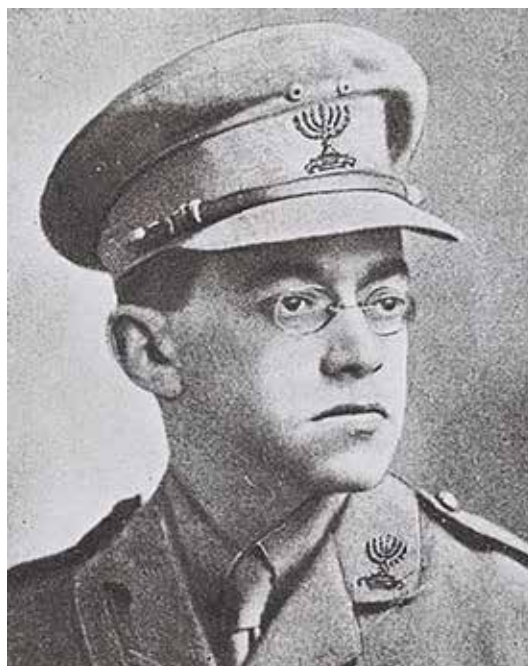
Vladimir Jabotinsky (1880-1940) her i 1918 i uniformen fra Jewish Legion , der indgik i Royal Fusiliers

Sluttelig dannede der sig også en politisk lejr, som formentlig bedst kan karakteriseres som liberal, der fremstillede sig som "Almene Zionister" og ønskede at stå over partikampene. Kemikeren Chaim Weizmann, som under Første Verdenskrig steg op som den afgørende figur inden for bevægelsen, var den drivende kraft i denne moderate