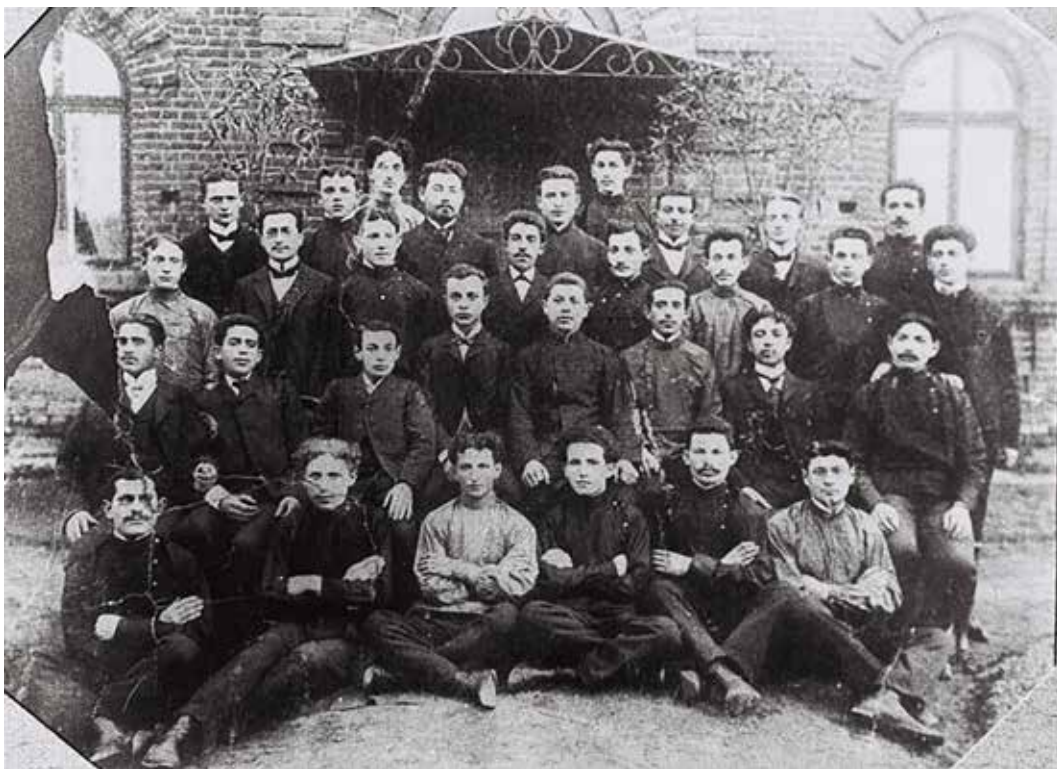
Poalei Zion's ”Ezra” gruppe i Plońsk, 1905. David Ben-Gurion ses i første række, tredje fra højre.

orienterede lejr, dannedes ikke ét men hurtigt flere konkurrerende partier. For det marxistisk prægede Poalei Zion (Zions Arbejdere) lå årsagen til alle antisemitiske onder i jødernes usædvanlige økonomiske situation. I en egen stat ville de regenerere økonomisk og i forbindelse med den socialistiske verdensrevolution sluttelig udgøre en normal socialistisk nation blandt andre. Mens Poalei Zion så sig som en jødisk-national aflægger af verdensrevolutionen, var Hapoel Hatzair (Den Unge Arbejder) mindre ideologisk præget. Dets tilhængere tænkte ganske vist også i socialistiske kategorier, men placerede dem efter den jødiske nationalisme. De betonedede særegenheden i den jødiske nation, som først måtte erobre sit eget territorium og gav den pragmatiske opgave af ”produk-