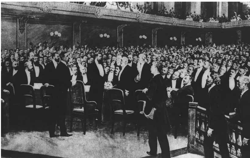
Theodor Herzl (lidt t.v.f. midten) omgivet af delegerede under den første zionistkongres i 1897.

De østeuropæiske jøder, der blev tvunget til udvandring, udgjorde Herzls naturlige tilhængerskab. Da Herzls i sommeren 1897 virkelig kunne åbne sin første zionistiske kongres i Basel (der viste sig at være et lettere sted at afholde kongressen end München), kom den største delegation fra Zarriget. Endvidere var mange af de vesteuropæiske og ame-