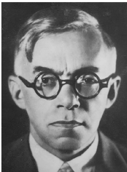
Vladimir Ze'ev Jabotinsky (1880-1940)

risk ønskede at virkeliggøre et sådant i Palæstina -, stod dens modpart for politisk og kulturel adskillelse, separation, og betonedede meget absolut inddelingen af mennesker i nationer med specifikke interesser. Resolutionen fra 1921 forekom i denne betragtning at være baseret på ren ønsketænkning. Vladimir Ze'ev Jabotinsky, chefteoretikeren i denne separatistiske ansats, anså ingen af de to nationalbevægelser i Palæstina som værende indstillede på et kompromis, hvorfor forståelse og frivillig inte-