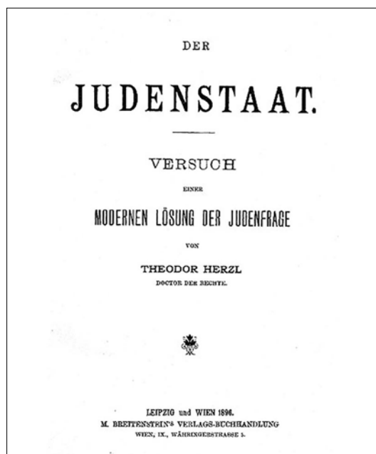
Titelsiden til originaludgaven af Der Judenstaat - Versuch einer modernen Lösung der Judenfrage

Alt dette udgjorde baggrunden for hans skrift Der Judenstaat . Han giver selv udtryk for sin skuffelse over den mislykkede emancipation: ”Vi har overalt ærligt forsøgt at synke ned i det omgivne folkefællesskab og kun at bevare vore fædres tro”,