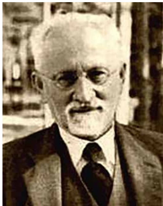
Simon Dubnow (1860-1941)