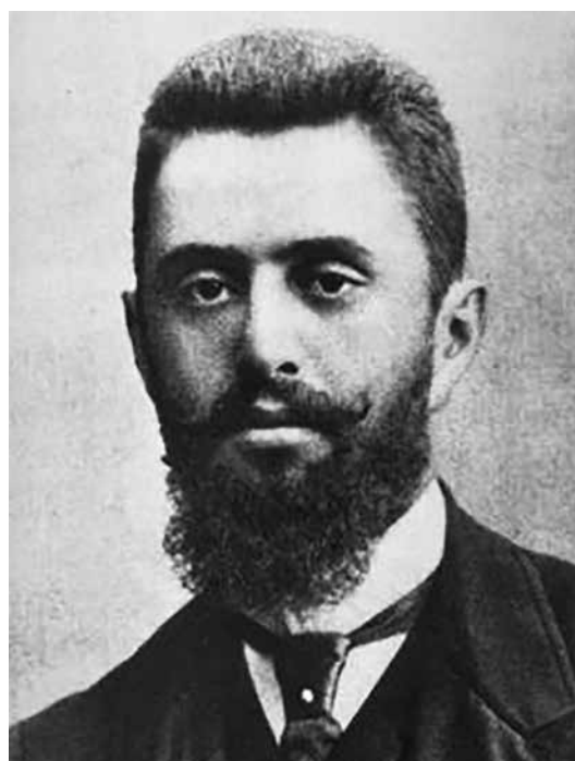
Theodor Herzl (1860-1904) foto fra ca. 1890

Rabbinernes modstand blev endnu tydeligere, da Herzl planlagde at afholde sin første zionistkongres i München i sommeren 1897. Rabbinerne afviste ligesom Israelitische Kultusgemeinde München et sådant møde, idet de dermed så en undergravning af de messianske planer, ifølge hvilke kun Messias kan genskabe jødestaten, og fordi de endvidere så deres status som tyske statsborgere af jødisk tro truet. De frygtede, at de ville give antisemitterne ammunition mod en dobbelt loyalitet. Wienerkritikeren Karl Kraus formulerede