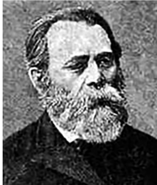
Leon Pinsker (1821-1891)

emancipationen som slået fejl og krævede i stedet jødernes selvemancipation som nation. Hvor nøjagtigt, de skulle finde deres hjemsted, lod Pinsker indledningsvist stå åbent og tænkte sige så meget på Argentina som på Palæstina.