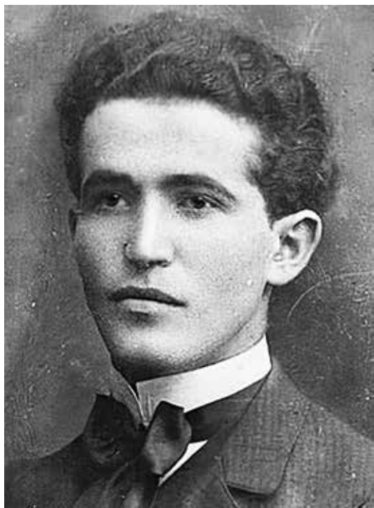
David Ben Gurion (1886-1973) (foto fra 1920)

og slet ikke at underordne eget mål om stor jødisk bosættelse. At dette mål ikke ville blive skadet, var i princippet betingelsen for enhver aftale. Mens