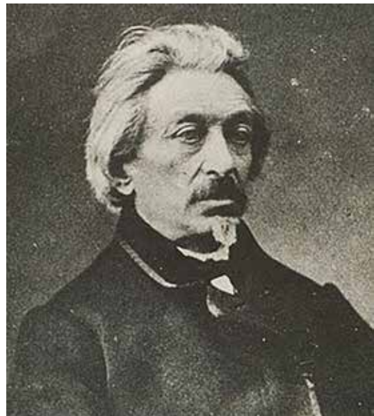
Moses Heß (1812-1875)

Moses Heß, der var en nær fortrolig af Marx, delte ikke denne kritik af jøderne. Deres fortsat beklagelsesværdige situation førte jøden fra Bonn tilbage til det forhold, at de ikke besad nogen egen stat. Under indtryk af den italienske Risorgimento forfattede Heß i 1862 sit skrift ”Rom og Jerusalem”. Således som det var lykkedes italienerne at bygge