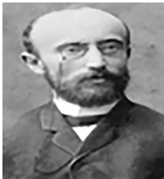
Achad Ha'am (1856-1927)

mislykkede assimilation, der udgjorde den største skuffelse, så så Achad Ha'am den afgørende fare i en mulig succes for assimilationen og de deraf betingede tendenser til jødedommens opløsning. Jøderne ville komme til at oprette en stat som alle andre. I sin kritik af Herzl fremførte Achad Ha'am derfor: ”Her ... finder man kun mekanisk efterligning uden enhver form for nationalt særpræg ...” Han talte i stedet for et åndeligt center i Palæstina, der skulle fungere som et nødvendigt forstadium, og hvorfra der skulle udgå en fornyelse af jødisk kultur i diasporaen. Hans zionisme betegnes ofte som ”kulturzionisme”.