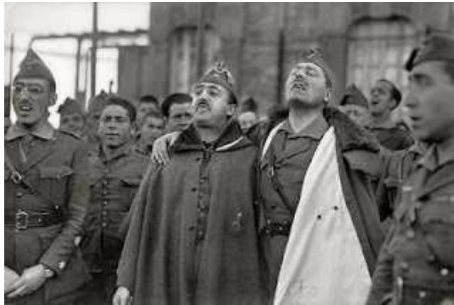
Francisco Franco og grundlæggeren af den spanske fremmedlegion José Millán Astray

Mens fascismen i Italien var larmende italiensk og nazismen larmende tysk, og den franske højrefløj larmende fransk ... var Francos spanske variant falangismen larmende spansk: streng højreorienteret og ultrakatolsk, sydende af had mod den franske revolution, rationalitet og borgerlig livsførelse. Leve døden, som var den spanske fremmedlegions kampråb, var et udtryk for det endelige opgør med det magelige, småborgerlige og hykleriske liberale samfund, hvor enhver hytter sit eget skind og kun tænker på at overleve. Det var dødens triumf.