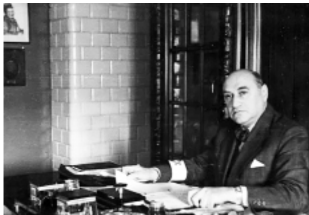
Adam Czerniaków (1880-1942) – formand for ”jøderådet” i Warszawas ghetto.

Den 22. juli kørte der nogle personbiler og to lastvogne med soldater op foran ”jøderådets” hovedbygning. Omkring femten SS-mænd, heriblandt nogle højere officerer, steg ud af personbilerne. Nogle blev nedenunder, de øvrige begav sig raskt og ufortøvet op på første sal til formanden, Adam Czerniakóws, kontor.