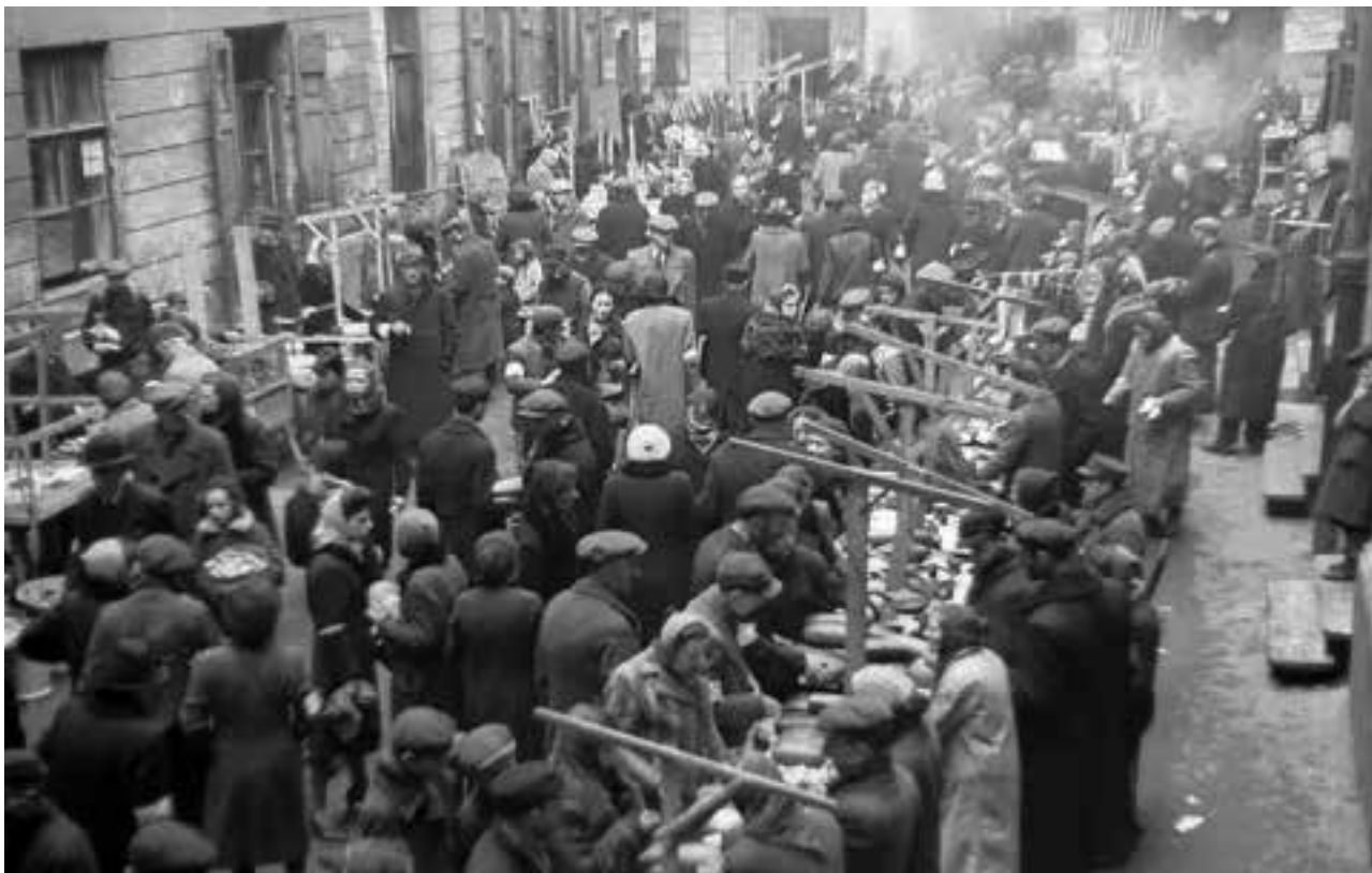
Warszawa-ghettoen i maj 1941 – markedsboder.

Kort efter kom adjudanten for tredje gang: Nu blev jeg kaldt ind til formanden; nu er det vel min tur, tænkte jeg, til at gøre gidslerne fuldtallige. Men jeg tog fejl. Under alle omstændigheder tog jeg, som vanligt når jeg gik ind til Czerniaków, en skriveblok og to blyanter med mig. I korridorerne stod der stærkt bevæbnede poster. Døren til Czerniakóws kontor stod åbent, hvilket ikke var normalt.