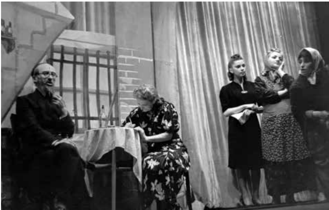
Warszawa-ghettoen i maj 1941 – opførelse i det jødiske teater.

Höfle åbnede nu mødet med ordene: ”Fra i dag begynder flytningen af jøderne fra Warszawa. I er jo klar over, at der er for mange jøder her. Jeg pålægger jer, ’jøderådet’, denne opgave. Udføres den omhyggeligt, frigives gidslerne også atter, i modsat fald bliver I alle klynget op - derovre.” Han viste med hånden over på legepladsen på den modsatte side af gade. Det var et efter forholdene i ghettoen ret smukt anlæg, der festligt var blevet indviet nogle få uger forinden: Et kapel havde spillet, børn havde danset og dyrket gymnastik, og der var, som vanligt, blevet holdt taler.