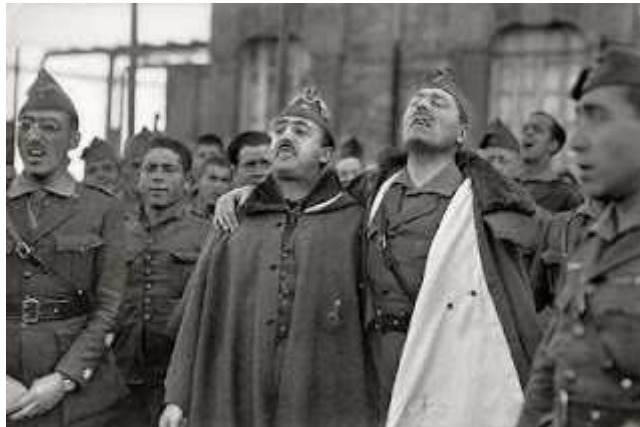
Francisco Franco og grundlæggeren af den spanske fremmedlegion José Millán Astray

Mens fascismen i Italien var larmende italiensk og nazismen larmende tysk, og den franske højrefløj larmende fransk ... var Francos spanske variant falangismen larmende spansk: streng højreorienteret og ultrakatolsk, sydende af had mod den franske revolution, rationalitet og borgerlig livsførelse. Leve døden, som var den spanske fremmedlegions kampråb, var et udtryk for det endelige opgør med det magelige, småborgerlige og hykleriske liberale samfund, hvor enhver hytter sit eget skind og kun tænker på at overleve. Det var dødens triumf.