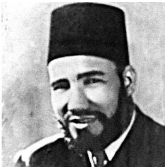
Hassan Al Banna grundlæggeren af Det Muslimske Broderskab

Og den larmende, emfatiske understregning af det særligt arabiske og eller islamiske kan ses på linje med mellemkrigstidens højreorienterede nationalistes altid enslydende understregning af unik særegenhed. Panarabismen og de europæiske højreorienterede nationalister havde begge filosofiske rødder i de tyske romantikere, Fichte og Nietzsche.